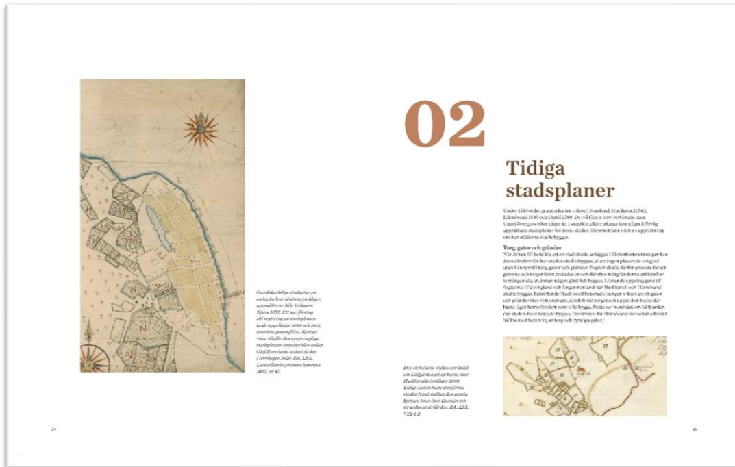
Uppslag ur boken, kapitel 2

Urbaniseringen påverkades även av andra faktorer, som ekonomiska förutsättningar, landhöjningen och flera stadsbränder. Boken har fått titeln "Äldre kartor över bottniska städer: bilder av urbaniseringen i norr". Manusets är granskat av fyra externa experter.