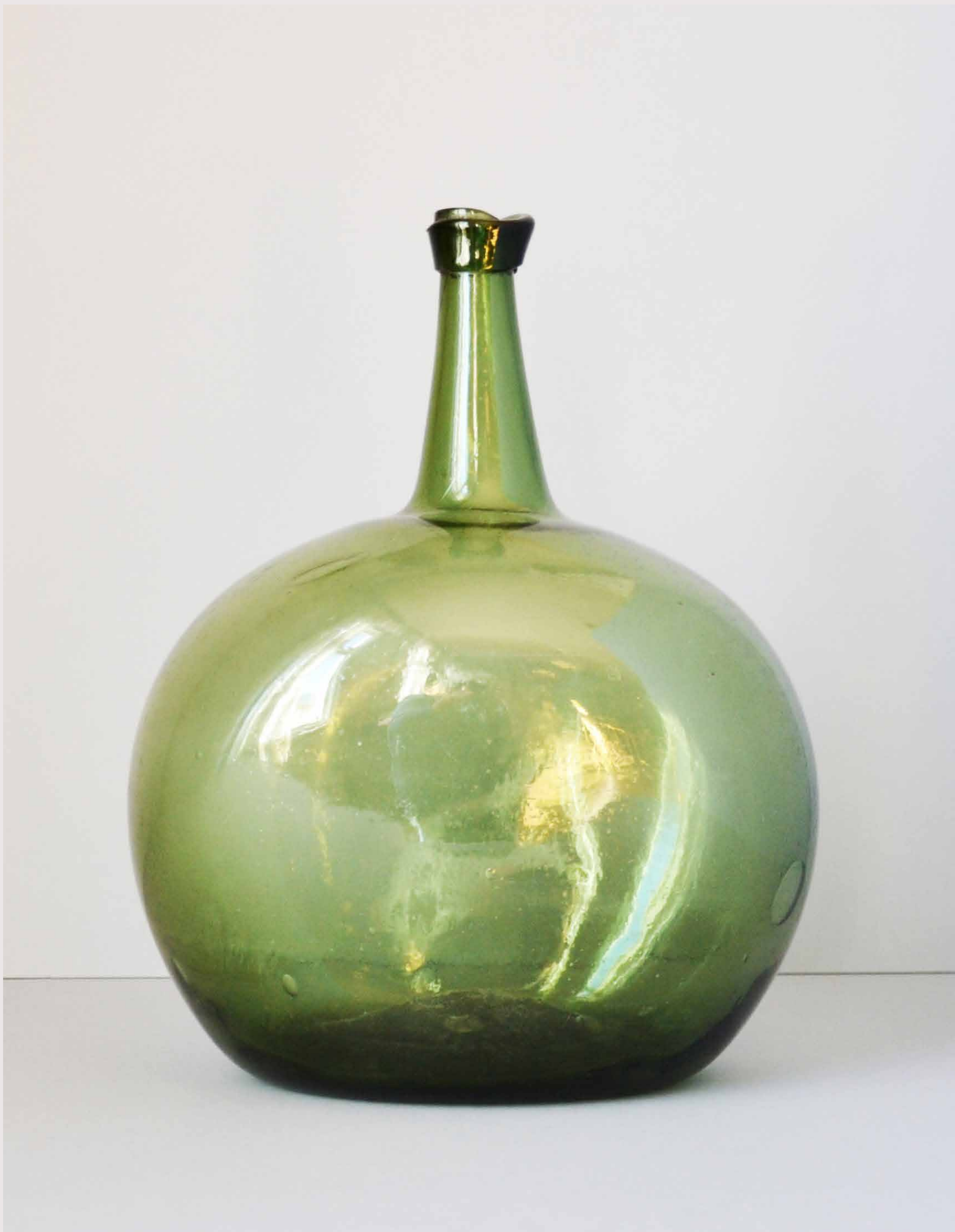
I Piteå museums samling finns denna butelj/vinflaska från Långviks glasbruk.