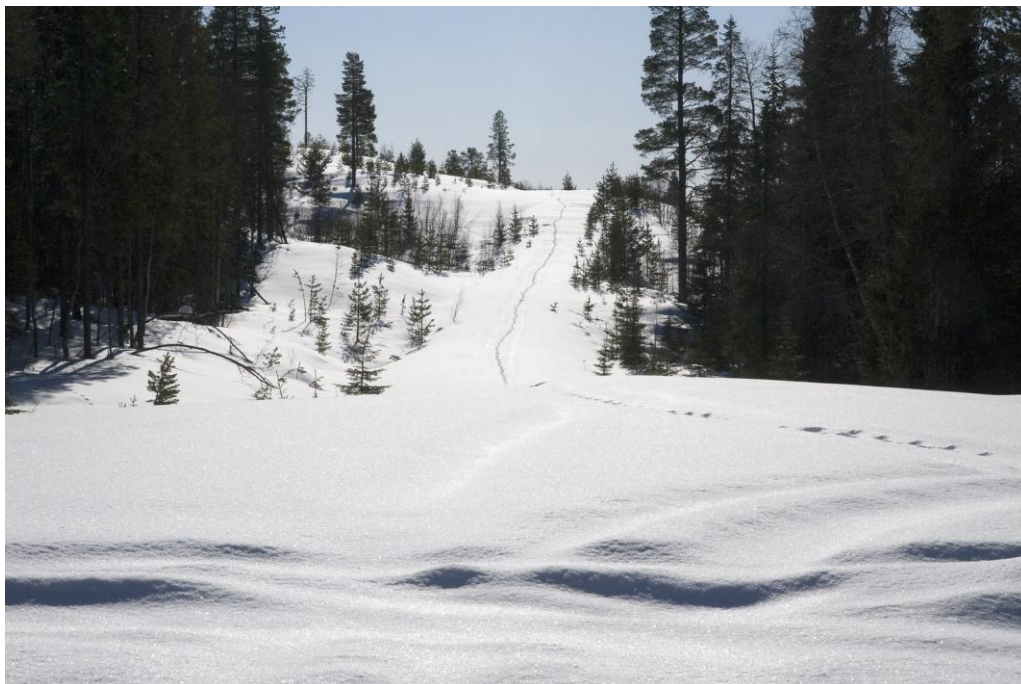
Spårnö, Markbygden vårvintern 2009.