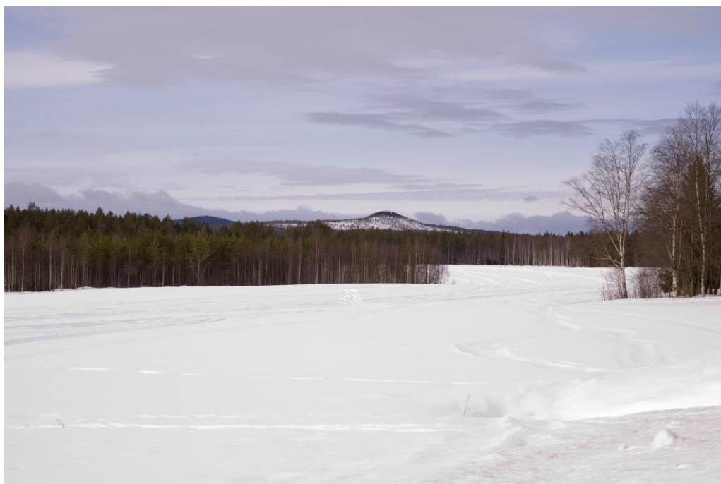
Lillpiteälven västerut mot Markbygden.