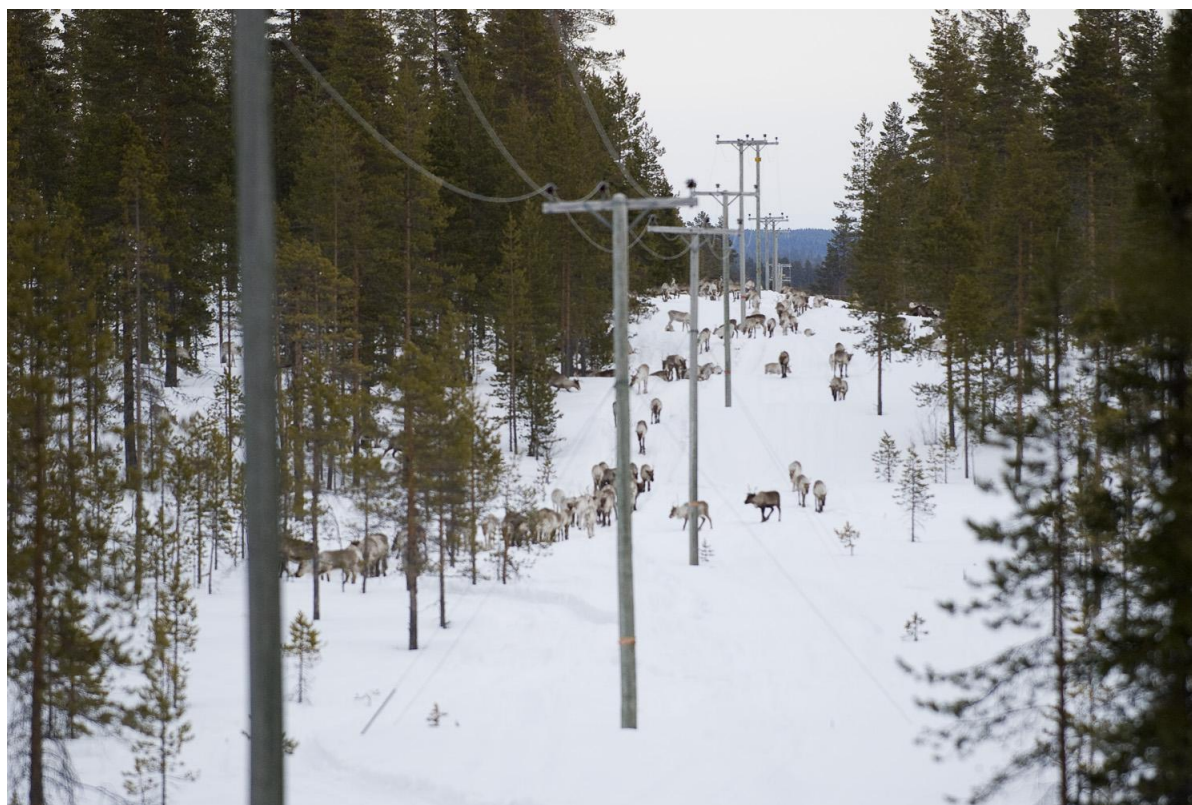
Vårflyttning vid Finnleden april 2009.

För rennäringen innebar järnvägens dragning rakt genom höstlandet nya problem. Markerna delades i en östlig och en västlig del. Även byggandet av vägar, som kom igång i slutet av 1800-talet, innebar ingrepp i traditionella betesmarker. Vägen mellan Piteå och Arvidsjaur drogs 1889-90. Från 1920 blev den uppgraderad till bilväg med vinterplogning. Skogsbrukets snabba förändring från 1940-talet och framåt med utbyggnad av nätet av skogsbilvägar påverkade också renskötseln i området. 31)