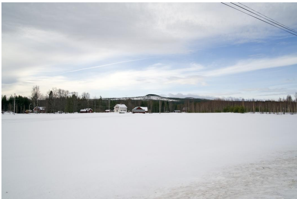
Byn Yttersta med Snöberget i bakgrunden.

Under senare delen av 1800-talet skedde en allmän befolkningstillväxt i landet. Nu kom inte bara folk från norrbottenskusten till Markbygden utan också från Skellefteå-trakten. 17) De magra jordarna utökades med hjälp av väldiga dikningsföretag. Myrarna var viktiga för bärning av foder till boskapen och även sjöar dikades ur och torrlades för nyodling. 18)