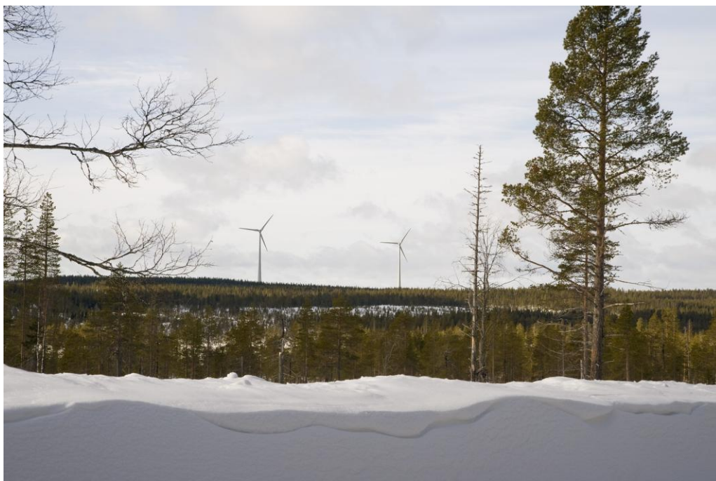
De två verken på Dragaliden. Vy från Ersträsk.