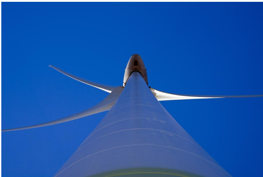
Vindkraftverk på Dragaliden i underifrånperspektiv.

Utbyggnaden av förnyelsebara energikällor är en prioriterad företeelse i den politiska sfären, framför allt på nationell nivå. Vindkraft lyfts fram som en miljövänlig energikälla och gynnas av statliga subventioner. Frågorna förs framåt av Energimyndigheten. Generellt sett är den nuvarande kunskapen om vindkraftens effekter på människor och djur bristfällig, men särskilda statliga medel för forskning om vindkraft och annan förnyelsebar elkraft finns att söka. I en proposition till riksdagen våren 2009 föreslås enklare regler för tillståndsprövningen för utbyggnad av vindkraft.