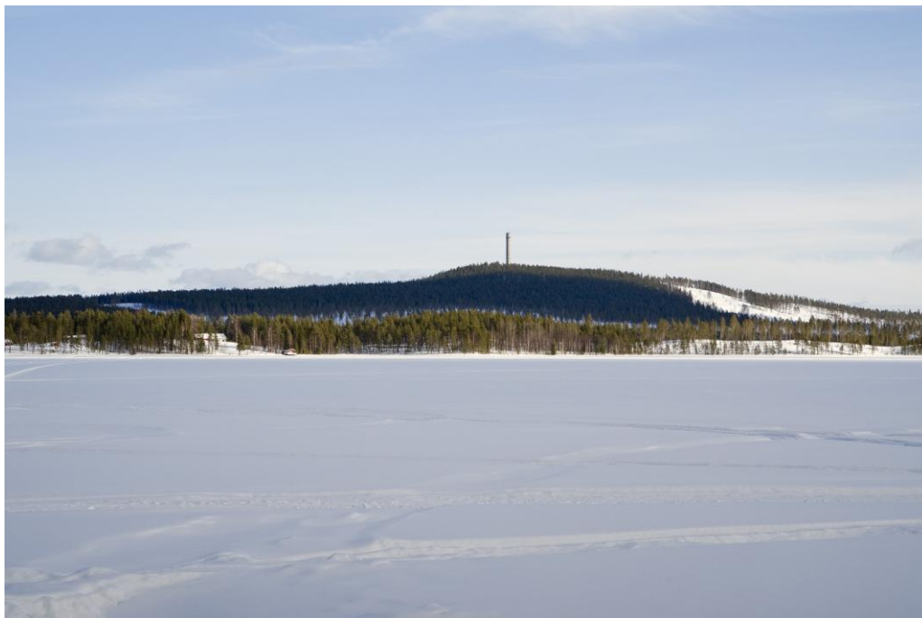
Stugbebyggelse vid Bänkerträsket med Bänkerberget i bakgrunden.

Piteå kommuns strategi för att skapa ett vindkraftcentrum för hela Barentsregionen i anslutning till Markbygdenprojektet bör också ingå i en dokumentation. Kommunen har sökt EU-medel för ett treårigt utvecklingsprojekt.